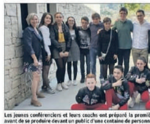
Les jeunes conférenciers et leurs coaches ont préparé la première Journée de l'audace Kids Corse, avant de se produire devant un public d'une centaine de personnes.

"Le principe des Journées de l'audace est de mettre en valeur les initiatives et expériences de personnes ordinaires qui font des choses extraordinaires, explique ce dernier. C'est afin d'insérer les gens à se dépasser, à se dire qu'ils sont capables de mieux. Ils ont