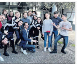
Les jeunes volontaires participant hier à leur dernière séance de coaching.