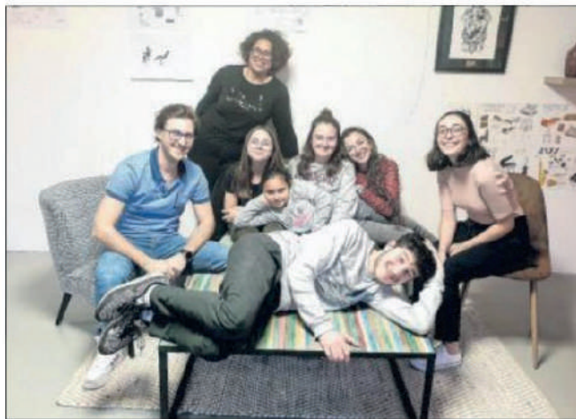
Séance de préparation pour les "kids" et leurs coaches.

Présentation de la structure de la conférence, travail de la voix, de la respiration, improvisation, gestion du